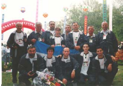
ARG elipa SRJ u Kini