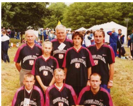
YU ARG ekipa u Mađarskoj