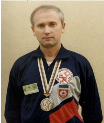
Bronzana medalja, ekipni plasman KT

IV svetski ŠARG 1988. godine u Švajcarskoj u Beatenbergu, mu je drugo IARU takmičenje. U kategoriji stariji seniori na 144 MHz osvaja 27. mesto a na 3,5 14. Nisu postojala sredstva za slanje ekipe. Ekipa je bila smeštena u kampu 5-6 kilometara od ostalih ekipa sa suvom hranom.